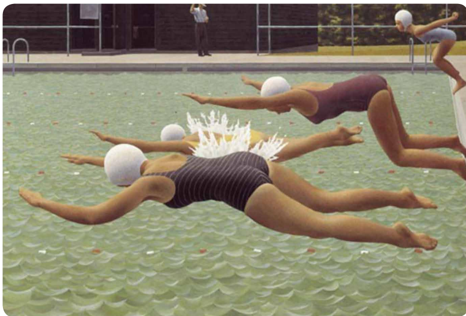
Artiste : Alex Colville